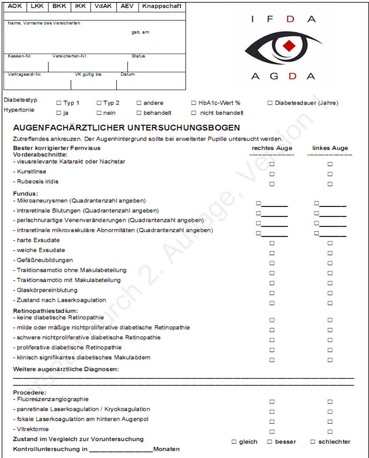
Abbildung 2: Dokumentationsbogen für die Augenuntersuchung (entnommen aus: Kurzfassung der DDG-Leitlinie „Diabetische Retinopathie und Makulopathie“)